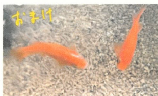
見とるよ... 見とるよ... 見とるよ...