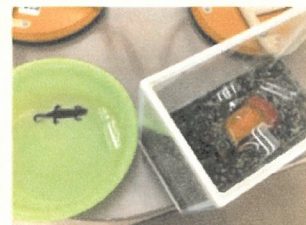
そうじしているところを見とるよ...