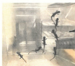
かべにはりつくイモリたち