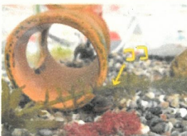
～寒くて食欲がないイモリ