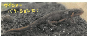
絶対に最高の冬にしてみせる!!