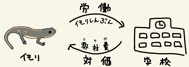
図：アカハライモリと学校の関係